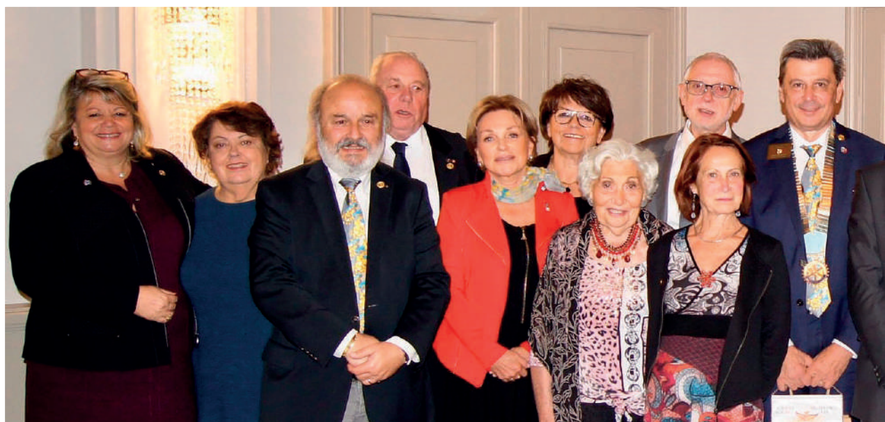
Membres du club en 2017