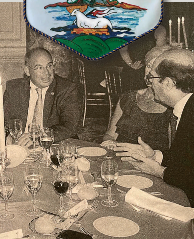
Moment convivial entre rotariens de notre club