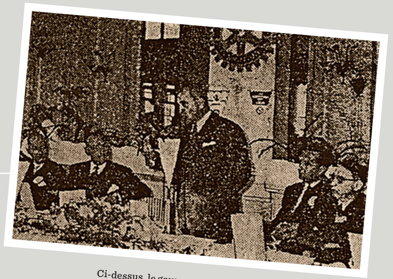
Ci-dessus, le gouverneur Giraud remet la charte au club. Nous sommes le 2 mars 1958, notre club voit officiellement le jour ! A gauche : L'ancien fanion du club, aujourd'hui remplacé (voir dernière page). Le nom du club intégrait toutes les communes avant d'être simplifié.